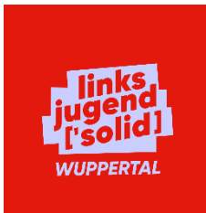
Linksjugend [solid'] Wuppertal