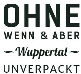
Ohne Wenn & Aber