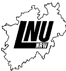
LNU Kreis Wuppertal