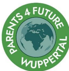
Parents for Future Wuppertal